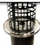
HAPPY, protez. liscia + maniglione