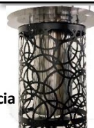
HAPPY, protez. lavorata