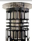
HAPPY, protez. liscia

La potenza e la durata possono variare, dipendono dalle condizioni, pressatura, umidità e tipologia del pellet immesso del totem.